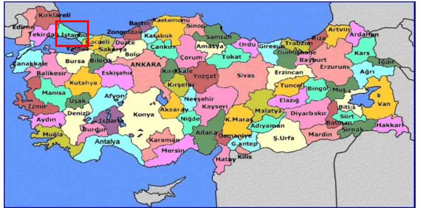
Harita 1 - İstanbul'un Konumu

İstanbul, Türkiye'nin en büyük kenti olup, yıllık %0 33.1 nüfus artışı ve 10 milyon kişiyi aşan nüfusu ile dünyanın da sayılı kentlerinden biri haline gelmiştir. Batı ile Doğu arasında köprü olma özelliği ile yerli ve yabancı sermaye için, bölgelerarası ilişki kurma ve bölgelere açılma yönünden önemli bir merkezdir. İstanbul Boğazı, Karadeniz'i, Marmara Denizi'yle birleştirirken; Asya Kıtası'yla Avrupa Kıtası'nı birbirinden ayırmakta ve İstanbul kentini de ikiye bölmektedir.