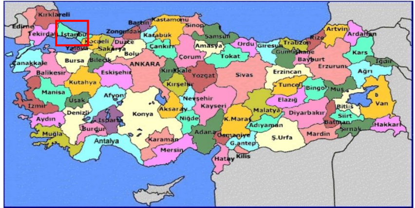
Harita 1 - İstanbul'un Konumu

İstanbul, Türkiye'nin en büyük kenti olup, yıllık %0 33.1 nüfus artışı ve 10 milyon kişiyi aşan nüfusu ile dünyanın da sayılı kentlerinden biri haline gelmiştir. Batı ile Doğu arasında köprü olma özelliği ile yerli ve yabancı sermaye için, bölgelerarası ilişki kurma ve bölgelere açılma yönünden önemli bir merkezdir. İstanbul Boğazı, Karadeniz'i, Marmara Denizi'yle birleştirirken; Asya Kıtası'yla Avrupa Kıtası'nı birbirinden ayırmakta ve İstanbul kentini de ikiye bölmektedir.