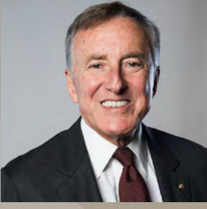
F. Bülent Eczacıbaşı

Eczacıbaşı Holding Yönetim Kurulu Başkanı Bülent Eczacıbaşı, çalışma yaşamına 1974 yılında başladı. 1991-1993 yıllarında Türk Sanayici ve İş İnsanları Derneği (TÜSİAD) Yönetim Kurulu Başkanlığı, 1997-2001 yıllarında TÜSİAD Yüksek İstişare Konseyi Başkanlığı, 1993-1997 yıllarında Türkiye Ekonomik ve Sosyal Etüdler Vakfı (TESEV) Kurucu Yönetim Kurulu Başkanlığı, 2000-2008 yıllarında ise İlaç Endüstrisi İşverenler Sendikası (İEİS) Yönetim Kurulu Başkanlığı yaptı. Bülent Eczacıbaşı, Eczacıbaşı Topluluğu kuruluşlarında Yönetim Kurulu Başkanlığı görevlerini yürütmektedir.