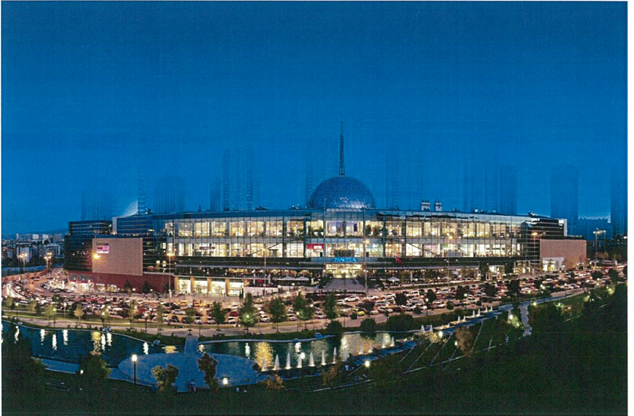
----- PANORA Alışveriş ve Yaşam Merkezi Or-An/ANKARA -----

01/01/2015 – 30/06/2015 DÖNEMİ FAALİYET RAPORU