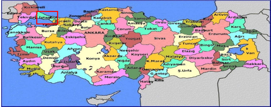
Harita 1 - İstanbul'un Konumu

İstanbul, Türkiye'nin en büyük kenti olup, yıllık %0 33.1 nüfus artışı ve 10 milyon kişiyi aşan nüfusu ile dünyanın da sayılı kentlerinden biri haline gelmiştir. Batı ile Doğu arasında köprü olma özelliği ile yerli ve yabancı sermaye için, bölgelerarası ilişki kurma ve bölgelere açılma yönünden önemli bir merkezdir. İstanbul Boğazı, Karadeniz'i, Marmara Denizi'yle birleştirirken; Asya Kıtası'yla Avrupa Kıtası'nı birbirinden ayırmakta ve İstanbul kentini de ikiye bölmektedir.