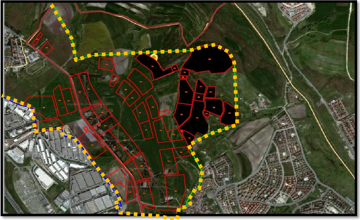
-Başakşehir-Esenyurt Hoşdere Bölgesi Rezerv Yapı Alanı Sınırları (20.09.2013 tarih, 14534 sayılı bakanlık oluru)

Değerleme konusu parsellerin tamamı rezerv yapı alanı sınırı içerisinde yer almaktadır.