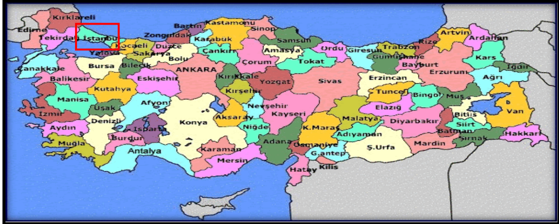
Harita 1 - İstanbul'un Konumu

İstanbul, Türkiye'nin en büyük kenti olup, 15 milyon kişiyi aşan nüfusu ile dünyanın da sayılı kentlerinden biri haline gelmiştir. Batı ile Doğu arasında köprü olma özelliği ile yerli ve yabancı sermaye için, bölgelerarası ilişki kurma ve bölgelere açılma yönünden önemli bir merkezdir. İstanbul Boğazı, Karadeniz'i, Marmara Denizi'yle birleştirirken; Asya Kıtası'yla Avrupa Kıtası'nı birbirinden ayırmakta ve İstanbul kentini de ikiye bölmektedir.