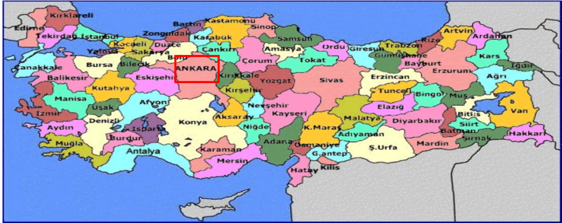
Harita 1 - Ankara'nın Konumu

Cumhuriyetin kuruluşundan günümüze, nüfusu ülke nüfusunun iki katı hızda artmıştır. Nüfusun yaklaşık dörtte üçü hizmet sektörü olarak tanımlanabilecek memuriyet, ulaşım-haberleşme ve ticaret benzeri işlerde, dörtte biri sanayide, %2'si ise tarım alanında çalışır. Sanayi, özellikle tekstil, gıda ve inşaat sektörlerinde yoğunlaşmıştır. Günümüzde ise en çok savunma, metal ve motor sektörlerinde yatırım yapılmaktadır. Türkiye'nin en çok sayıda üniversiteye sahip ili olan Ankara'da ayrıca, üniversite diplomalı kişi oranı ülke ortalamasının iki katıdır.