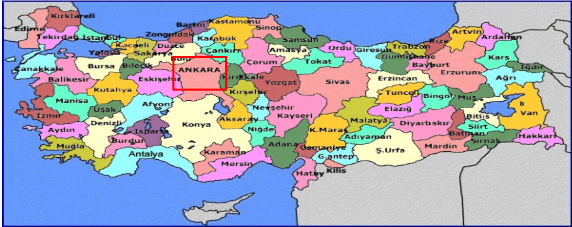
Harita 1 - Ankara'nın Konumu

Cumhuriyetin kuruluşundan günümüze, nüfusu ülke nüfusunun iki katı hızda artmıştır. Nüfusun yaklaşık dörtte üçü hizmet sektörü olarak tanımlanabilecek memuriyet, ulaşım-haberleşme ve ticaret benzeri işlerde, dörtte biri sanayide, %2'si ise tarım alanında çalışır. Sanayi, özellikle tekstil, gıda ve inşaat sektörlerinde yoğunlaşmıştır. Günümüzde ise en çok savunma, metal ve motor sektörlerinde yatırım yapılmaktadır. Türkiye'nin en çok sayıda üniversiteye sahip ili olan Ankara'da ayrıca, üniversite diplomalı kişi oranı ülke ortalamasının iki katıdır.