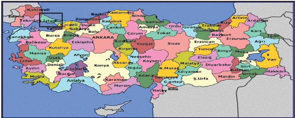
Harita 1 - İstanbul'un Konumu

İstanbul, Türkiye'nin en büyük kenti olup, 13 milyon kişiyi aşan nüfusu ile dünyanın da sayılı kentlerinden biri haline gelmiştir. Batı ile Doğu arasında köprü olma özelliği ile yerli ve yabancı sermaye için, bölgelerarası ilişki kurma ve bölgelere açılma yönünden önemli bir merkezdir. İstanbul Boğazı, Karadeniz'i, Marmara Denizi'yle birleştirirken; Asya Kıtası'yla Avrupa Kıtası'nı birbirinden ayırmakta ve İstanbul kentini de ikiye bölmektedir.