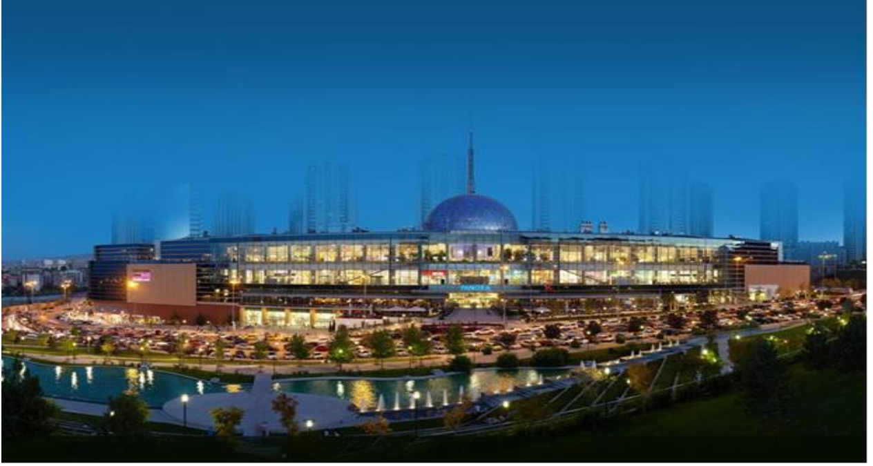
----- PANORA Alışveriş ve Yaşam Merkezi Oran/ANKARA -----

Şirketimiz portföyünde 2007 yılında tamamlanarak faaliyete geçen PANORA Alışveriş ve Yaşam Merkezi bulunmaktadır. Gayrimenkule ilişkin bilgi ve görseller aşağıda sunulmuştur.