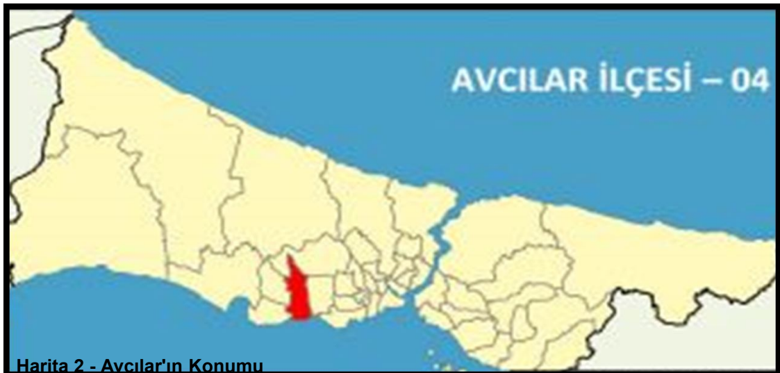
Harita 2 - Avcılar'ın Konumu

Avcılar'da sanayi tesislerinin gelişmesiyle balıkçılık, bağcılık ve tarım tarihe karışmış, bunların yerini sanayi, ticaret ve rekreasyon(eğlence-dinlenme) tesisleri almıştır. Avcılar'da başta madeni eşya, dokuma, giyim eşyası olmak üzere irili ufaklı 250'den fazla sanayi tesisi faaliyettedir. Buna göre nüfusun %40'ından fazlasını işçiler, %10'unu bölge esnafı ve küçük çapta memur kesimi oluşturmaktadır. İlçede bir çok eğitim kurumu vardır. Bu kurumların içinde, İstanbul Üniversitesi Avcılar Kampüsü büyük öneme sahiptir. Kampüste Mühendislik, Veterinerlik, İşletme Fakülteleri, Teknik Bilimler Yüksek Okulu bulunmaktadır.