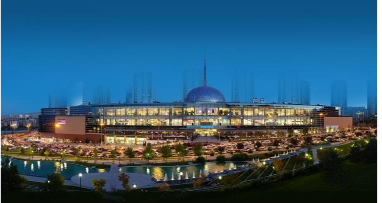
----- PANORA Alışveriş ve Yaşam Merkezi Oran/ANKARA -----

Şirketimiz portföyünde 2007 yılında tamamlanarak faaliyete geçen PANORA Alışveriş ve Yaşam Merkezi bulunmaktadır. Gayrimenkule ilişkin bilgi ve görseller aşağıda sunulmuştur.