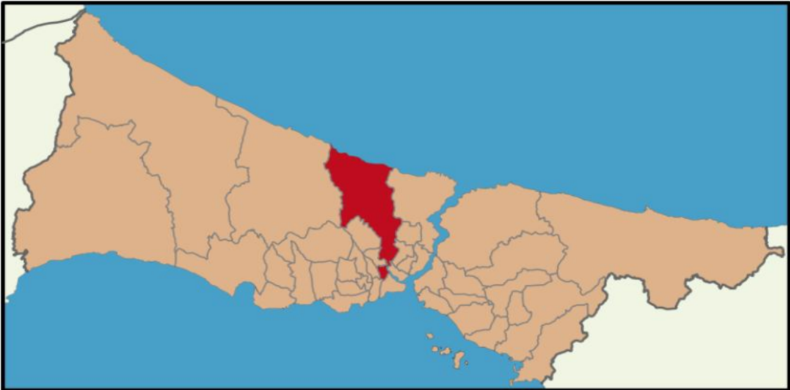
Kroki-8: Eyüp'ün İstanbul'daki Konumu

Eyüp ilçesi kırsal alanında Kemerburgaz şube ve bağlı olarak Mimar Sinan ve Mithatpaşa mahalleleri, Göktürk, Akpınar, Ağaçlı, Çiftalan, İhsaniye, Işıklar, Odayeri, Pirinççi ve Yayla köyleri yer almaktadır.