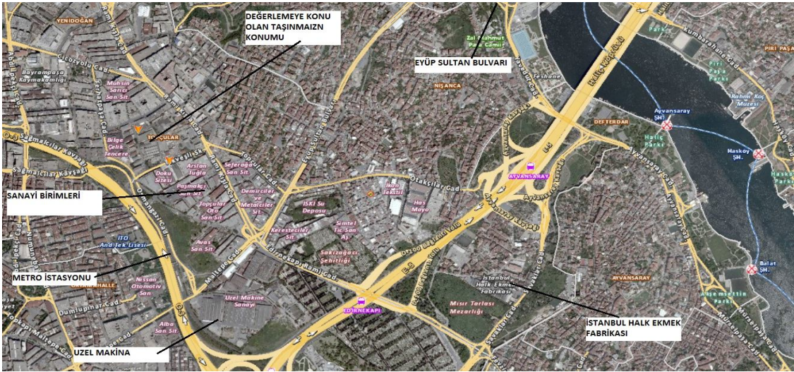
Kroki-2: Taşınmazın Konumu

Değerlemesi yapılan taşınmazlara Edirnekapı Caddesi ve Rami-Kışla Caddesi üzerinden Tikveşli Sokak ile ulaşılabilir. Bölge sanayi alanı niteliğinde olup blok düzen şeklinde yapılaşmıştır. Yakın çevredeki şehitlik ve mezarlık nirengi noktalarıdır. Seferağan, Avas Sanayi Sitesi, Pasmakçı Sanayi Sitesi, Doku Sitesi, Ozar Sanayi Sitesi, Kanbay Sitesi, Sarıcı Metal Sanayi, Apek ve Yüner İplik Emintaş ... gibi sanayi siteleri bulunmaktadır. İş Bankası, Kuveyttürk, Türkiye Finans Katılım Bankası, Garanti Bankası, Yapı Kredi, Akbank ... gibi banka şubeleri de yol aksı Rami-Kışla Caddesi üzerinde yer seçmişlerdir. Yakın çevrede meslek okulu ve camii ... gibi donatı alanları bulunmaktadır.