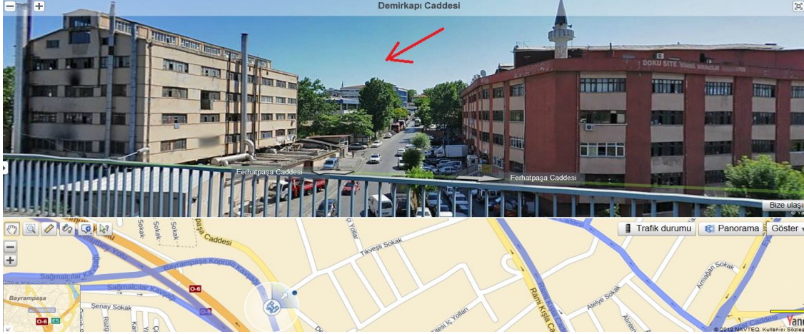
Kroki-5: Taşınmazın Konumu ve Cephe Aldığı Tikveşli Sokak'tan Görünümü

Taşınmazın bulunduğu bölgede değişim ve dönüşüm çalışmaları özellikle Bayrampaşa odaklı olarak başladığı görülmüştür. Bayrampaşa Kaymakamlığı çevresidne otel yatırımlarının, D-100 Maltepe çevresinde rezidans yatırımlarının sürdüğü ve taşınmazın bulunduğu bölgede yeni dönüşüm çalışmalarının devam edeceği öngörülmüştür.