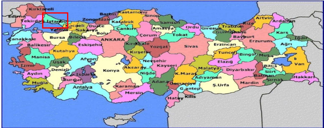
Kroki-7: İstanbul'un Konumu

İstanbul, Türkiye'nin en büyük kenti olup, 13 milyon kişiyi aşan nüfusu ile dünyanın da sayılı kentlerinden biri haline gelmiştir. Batı ile Doğu arasında köprü olma özelliği ile yerli ve yabancı sermaye için, bölgelerarası ilişki kurma ve bölgelere açılma yönünden önemli bir merkezdir. İstanbul Boğazı, Karadeniz'i, Marmara Denizi'yle birleştirirken; Asya Kıtası'yla Avrupa Kıtası'nı birbirinden ayırmakta ve İstanbul kentini de ikiye bölmektedir.